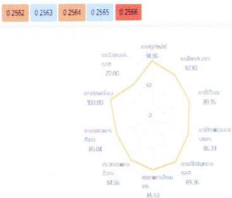
ผลการประเมินรายตัวชี้วัด